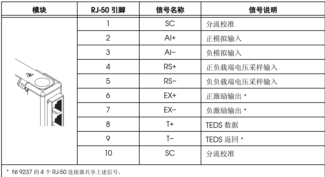
表 2 引脚说明和信号名称

关于 NI 9237 的引脚说明以及信号名称见表 2。关于 NI 9949 的连接说明见图 1。